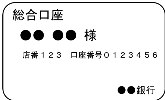
【通帳の表側 (イメージ)】